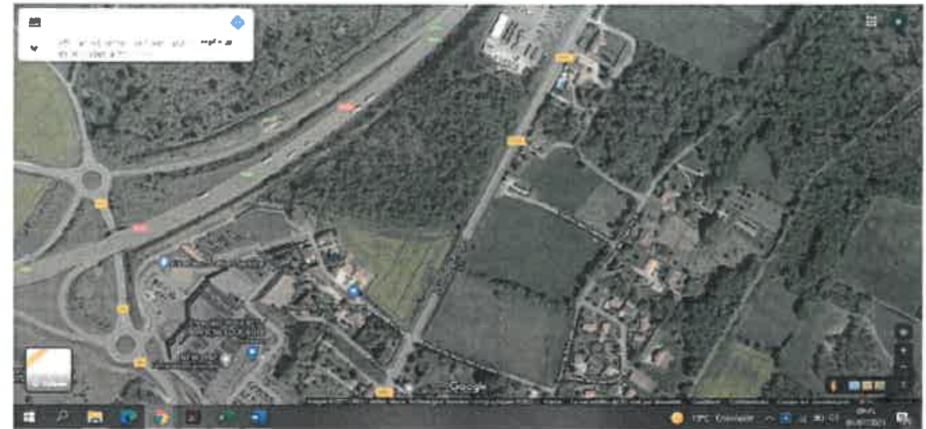
CHEMIN DU BOIS DES LANDES