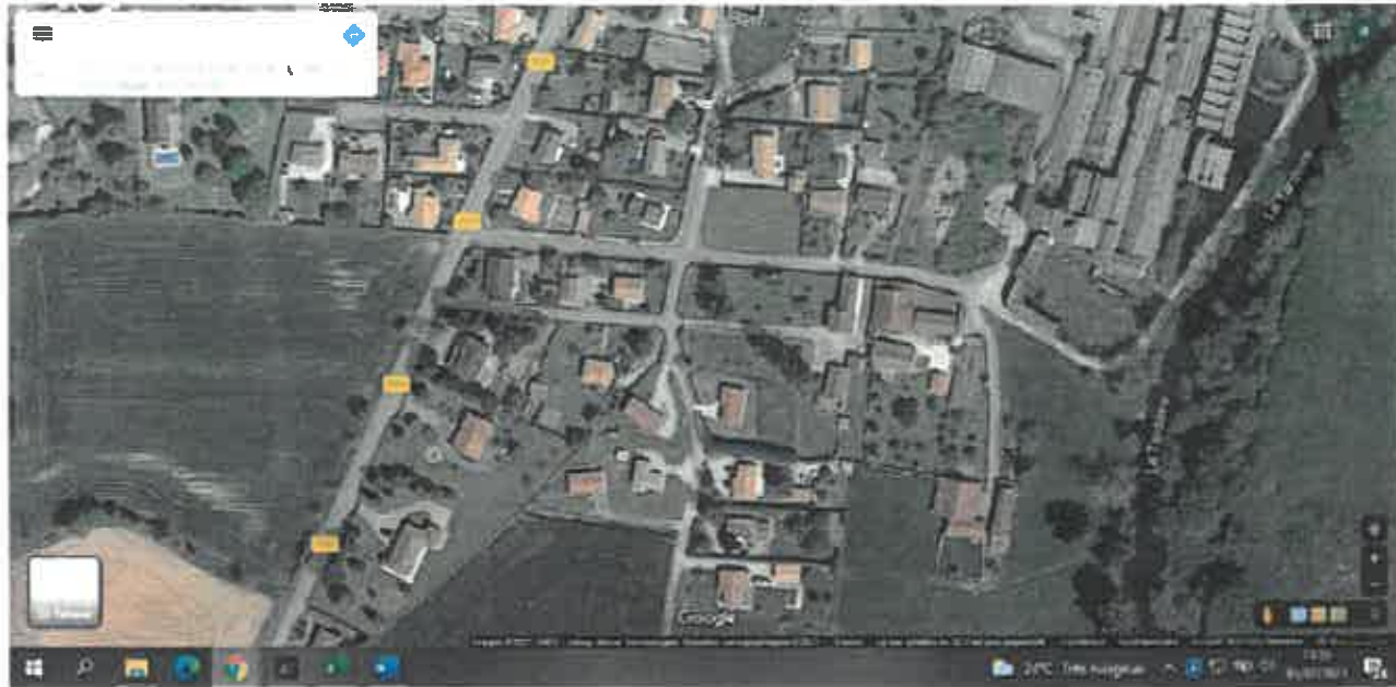
RUE DE LA CROIX