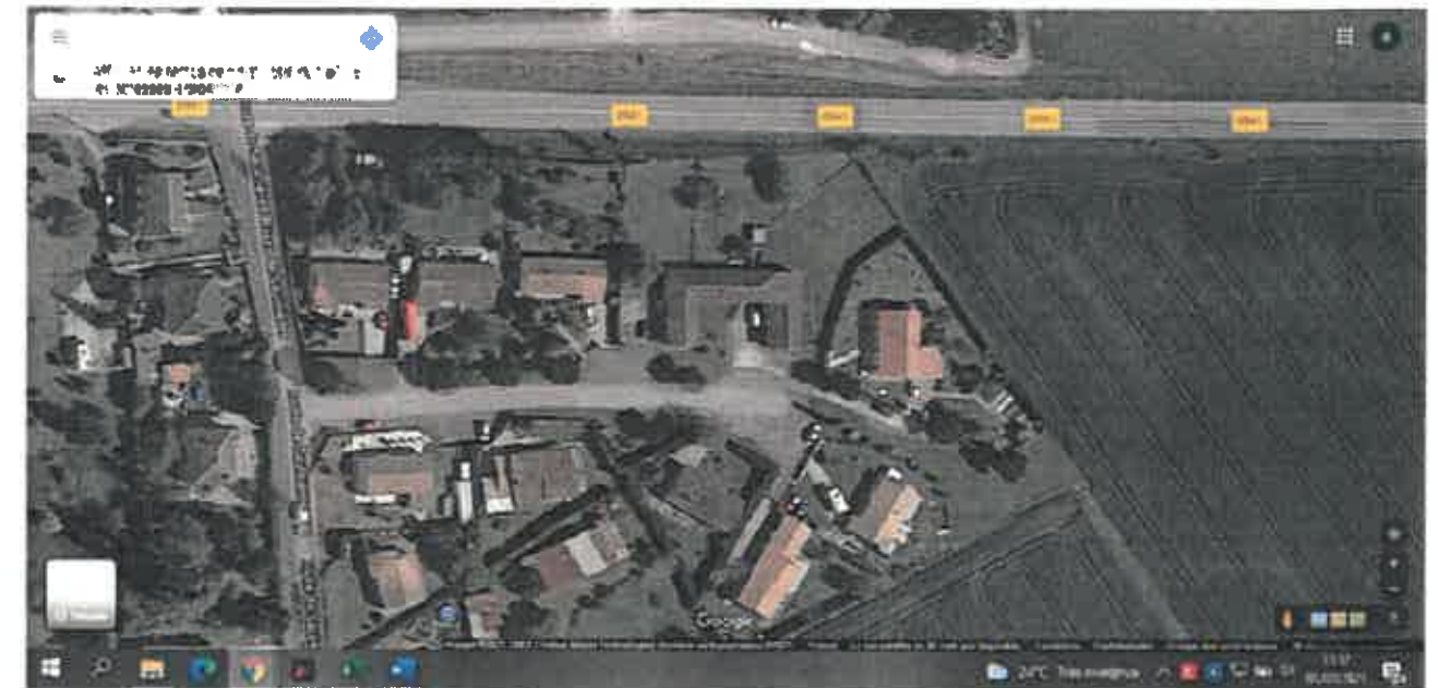
LOTISSEMENT DU PUIT